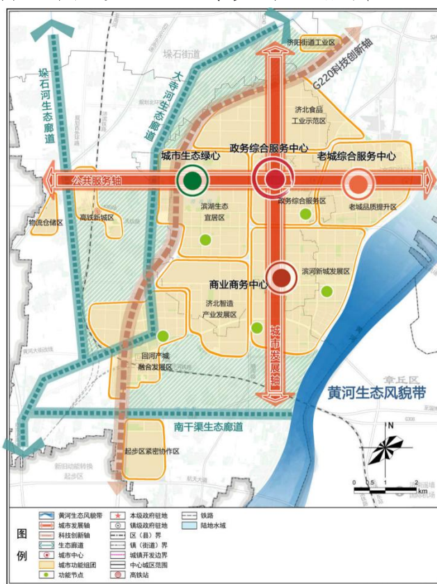
图 2 济阳中心城区空间格局

点培育科技金融、总部办公、商业休闲等服务功能的商业商务中心。 多区 ：形成济北食品工业示范区、政务综合服务区、滨湖生态宜居区、老城品质提升区、济北智造产业发展区、回河产城融合发展区、滨河片区、起步区紧密协作区、济滨高铁济阳站片区、物流仓储区、济阳街道工业区等多个功能片区。